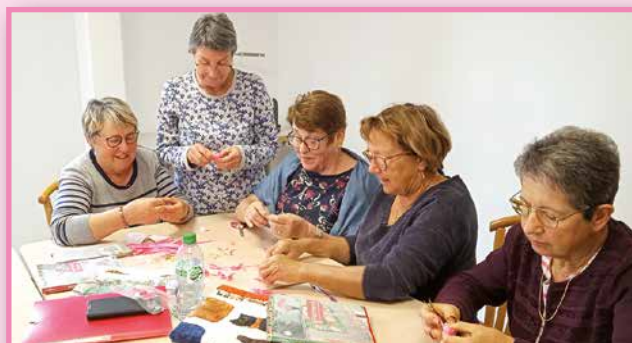
Les membres des loisirs créatifs ont œuvré pour octobre rose en confectionnant des petits nœuds.